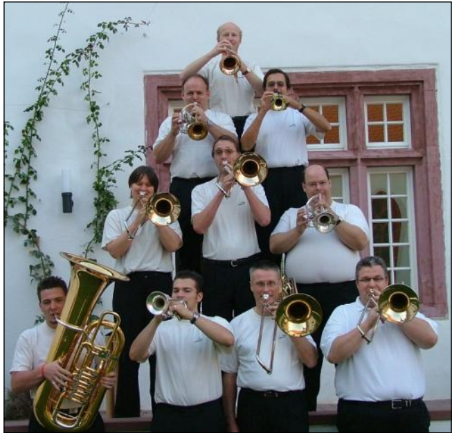
Da fliegt mir doch das Blech weg: „Blech Pur“

Die Dekanatsbläserstage enden mit einem Festgottesdienst am Sonntag, 8. Oktober, um 10.30 Uhr im Markwald-Gemeindezentrum der Bon-